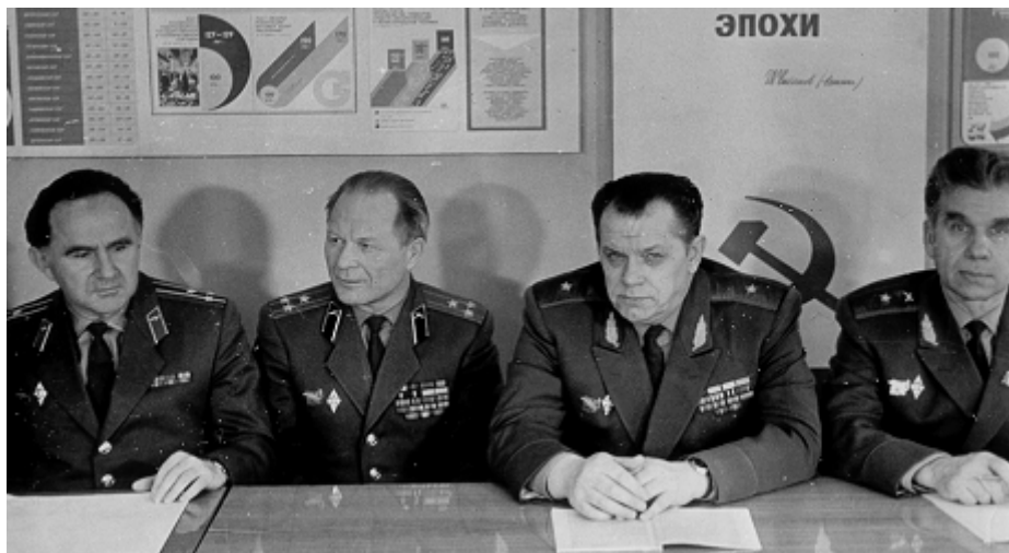
Принятие решения о приеме к защите очередного соискателя