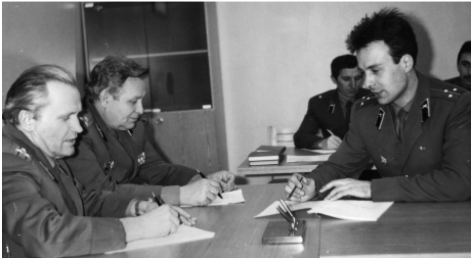
Прием кандидатского экзамена по философии