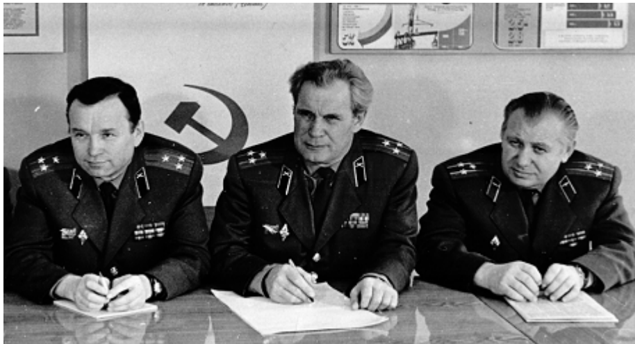
Прием экзамена по специальности