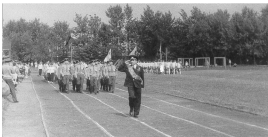
Открытие спортивного праздника